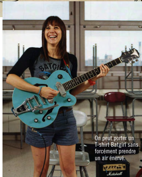
On peut porter un T-shirt Batgirl sans forcément prendre un air énérvé.