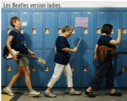
Les Beatles version ladies.